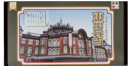
準備でき次第、期間限定で掛け紙に金賞受賞のロゴをデザインします

2019年以来、約4年半ぶりとなる2024年4月にリニューアル。1つの折で東京の老舗7店の味をお楽しみいただけます！